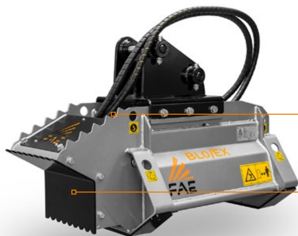
Bloc hydraulique avec vanne de régulation de débit intégré au moteur