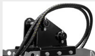
Kit plaque d'attache boulonné pins