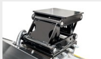
Attache basculante auto-nivelante qui s'adapte à tous les types de terrain